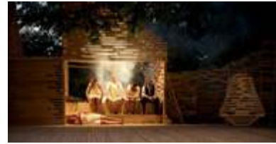
Kadriik Tiir Arhitektide kujundatud suvelava Rakvere Teatril (2011)