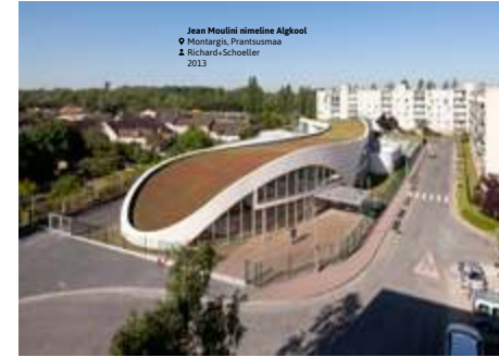
Jean Moulini nimeline Algkool Montargis, Prantsusmaa