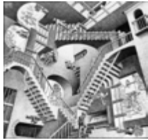
Hollandi graafiku M. C. Escheri teos "Relativitas" (1953)