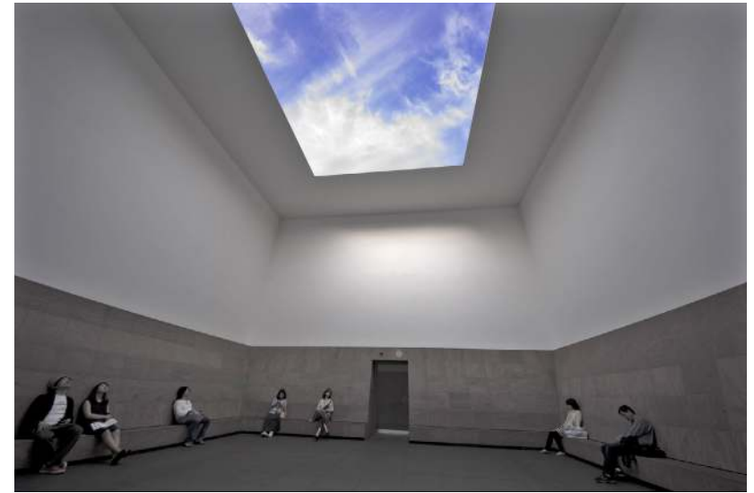
Работа американского художника, изучающего свет и пространство, Джеймса Таррелла «Открытое небо» (Open Sky) в художественном музее на острове Наосима в Японии.

Для наблюдения и созерцания не нужно забираться куда-то высоко. Низкое и длинное помещение хорошо подходит для созерцания открывающейся перспективы. Если подзорная труба (по-эстонски – rikkisilm или длинный глаз) как бы удлинит глаз и приближает рассматриваемый объект, то про этот павильон можно сказать, что он расширяет поле видения, позволяя еще долгое время наблюдать за передвижением северных оленей.