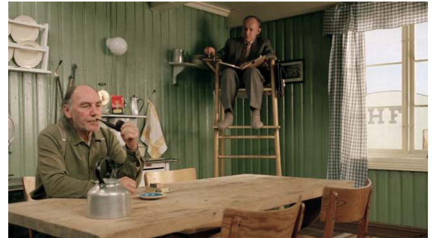
Кадр из фильма «Кухонные байки» («Салмер фра Кйоккенет», Норвегия, 2003)

«Полевые» работы требуют подготовки. Прежде, чем выйти из дома, необходимо определить цель и составить план действий. Это не предполагает глубокого анализа. Самое важное понять, что собой представляет тема изучения или вопрос исследования, и продумать, как разумно и удобно можно картографировать тему. Так как проект «Kooliguum»