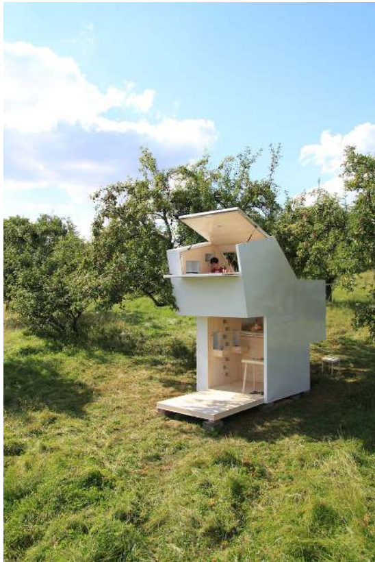
Складной домик по проекту немецких архитекторов из студии Allergutendinge под названием Seelenkiste.

Seelenkiste (Коробка для души) – это маленький домик, создатели которого получили вдохновение от идеи Аркадии, идеалистической жизни среди природы. На самом высоком этаже «коробки для души» находится самое важное место этого сооружения - рабочий стол, открытый для красивого мира. Это место размышлений и творения, откуда можно созерцать линию горизонта и заглянуть внутрь себя. Может быть, «коробку для души» можно назвать и «Башней самосозерцания».