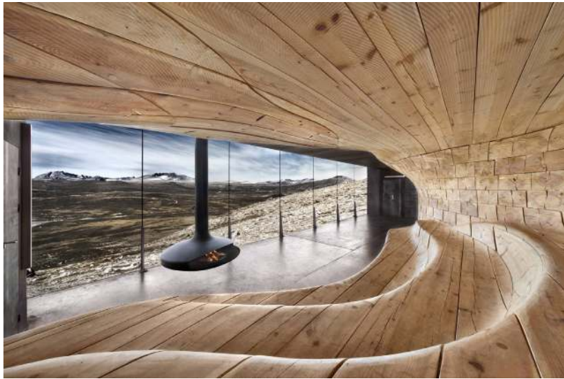
В Норвегии в национальном парке Доврефьель-Сундалсфьелла по проекту архитекторов бюро «Snøhetta» построен павильон для наблюдений за дикими северными оленями.

Для наблюдения и созерцания не нужно забираться куда-то высоко. Низкое и длинное помещение хорошо подходит для созерцания открывающейся перспективы. Если подзорная труба (по-эстонски – rikkisilm или длинный глаз) как бы удлинит глаз и приближает рассматриваемый объект, то про этот павильон можно сказать, что он расширяет поле видения, позволяя еще долгое время наблюдать за передвижением северных оленей.