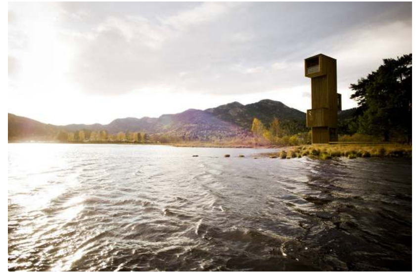
Смотровая вышка, спроектированная архитекторами бюро «Rintala Eggertsson Architects», на берегу озера Сельюр в Норвегии.

Архитекторы, для того чтобы наблюдать, подмечать и исследовать, предлагают и воплощают в жизнь различные формы. На следующих страницах несколько таких примеров.